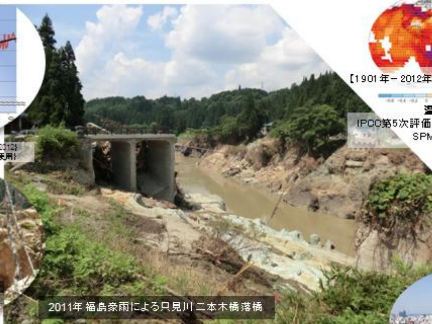
2011年 福島豪雨による只見川 二本木橋落橋