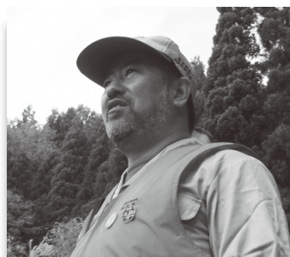
西 信介 にし のぶすけ