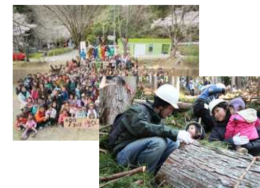
印刷物・HP・イベント開催時に地域に発信して普及啓発する