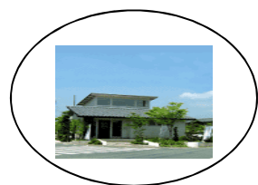
自社の購入電力 100%グリーン電力