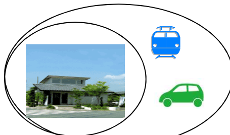
スコープ1、2およびスコープ3の一部