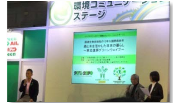
環境コミュニケーションステージ