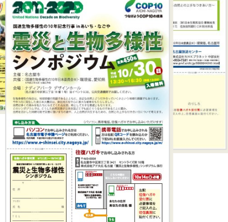
震災と生物多様性シンポジウムのチラシ