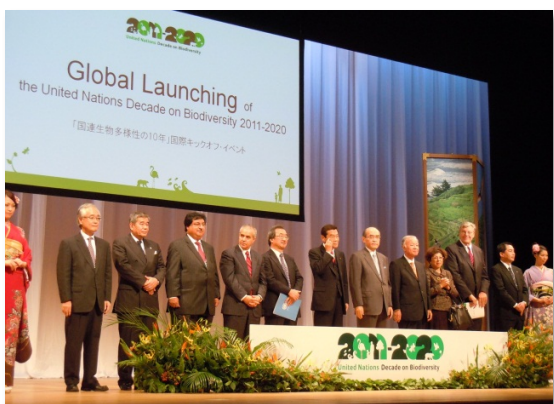
記念式典オープニング