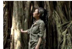
COP10名誉大使MISIA メッセージ映像