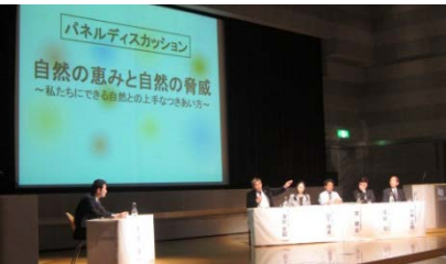
震災と生物多様性シンポジウム パネルディスカッション