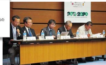
パネルディスカッション「国連生物多様性の10年」に向けた地域の取組