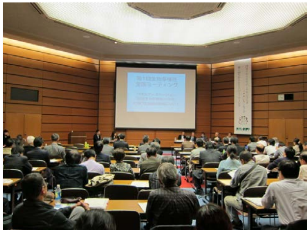
平成23年度生物多様性全国ミーティング会場の様子