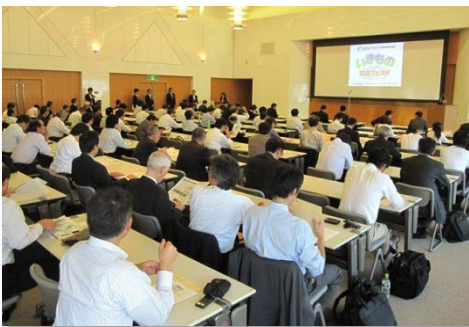
全国生物多様性自治体フォーラム

2011.10. 7、10.30 愛知県名古屋市 国連生物多様性の10年キックオフ in あいち・なごや[共催]