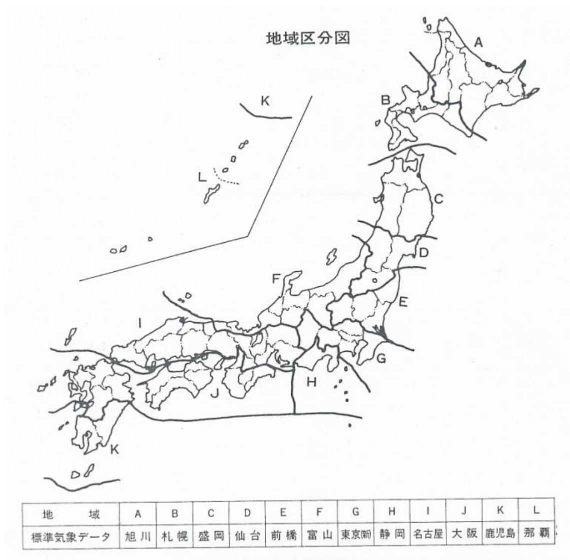
図2 地域区分図