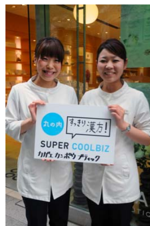
「宣言」はボードを持って行きます