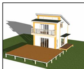
<チャレンジ25ハウス Ver.2.0>