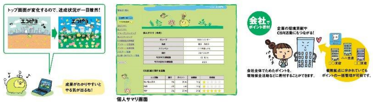
図：トップ画面の変化、個人サマリー画面、ポイント還元のイメージ

(参考) 環境省「エコ・アクション・ポイント」公式サイト → http://www.eco-action-point.go.jp/ JCB「エコ・アクション・ポイント」運営サイト → http://eco-ap.jp/