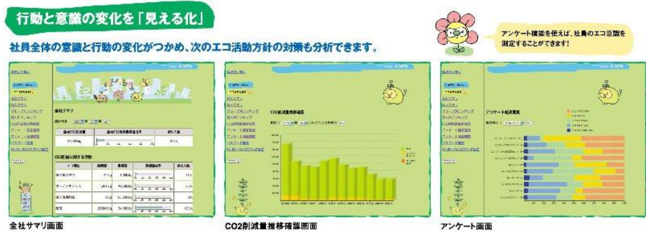
図：活動進捗、アンケート画面などのイメージ

個人のパソコンから、全社の活動進捗、個人別・組織別ランキングなど、成果をわかりやすく見える化して活動状況をチェックすることができます。また、活動実施前と実施後と比較して、意識や行動の変化を測定するアンケート機能を標準装備。システム利用効果を定量化することができます。