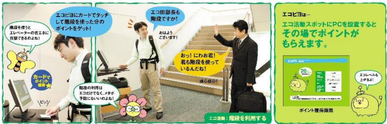
図:利用シーンイメージ

具体的にポイント化できるエコ活動の事例は、「エレベータを使わず階段を利用する」、「外光を利用して仕事をする」、「マイカップ・マイボトルを利用する」、「出張せずTV会議システムを利用する」、「コピー方法の工夫で紙使用量を削減する」などがあり、特にWEB上での自己申告方式においては、ユーザー企業ごとに独自のエコ活動を設定することもできます。