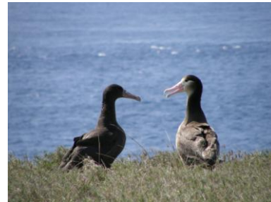
図1 (左) 2009年4月23日、金属足環(13B-2604)付き亜成鳥(5歳)