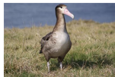
図3(左) 2010年2月 8日、「腹部が白く頭部が茶色」亜成鳥(推定7-8歳)