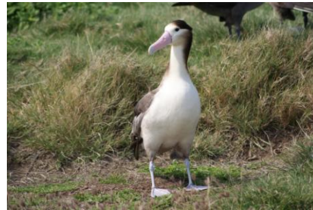
図8(左) 2009年4月20日(聳島鳥島)亜成鳥2羽(左:金属足環あり, 右:足環なし)の求愛ダンス 図9(右) 2010年3月14日(聳島鳥島)「腹部が白く頭部が黒い」亜成鳥(推定5歳以上)。図8の右側と同個体と推定。