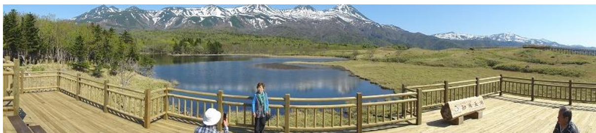
(湖畔展望台からの眺望)