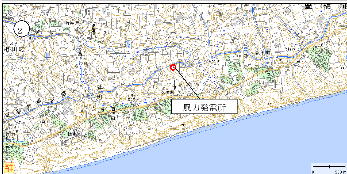
測定点周辺平面図 (豊橋市、田原市)