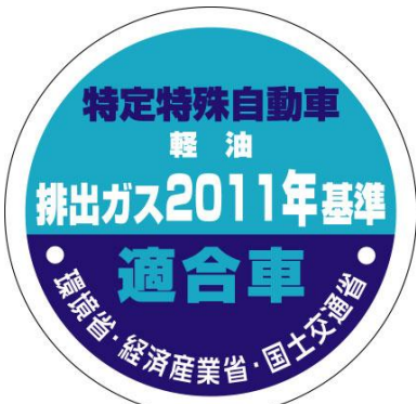
型式届出特定特殊自動車用 (改正基準に適合するもの)

改正基準に適合した特定特殊自動車に付する様式として、下記の3つが追加となります。