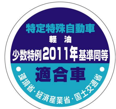
少数生産車用 (改正基準と同等性能のもの)