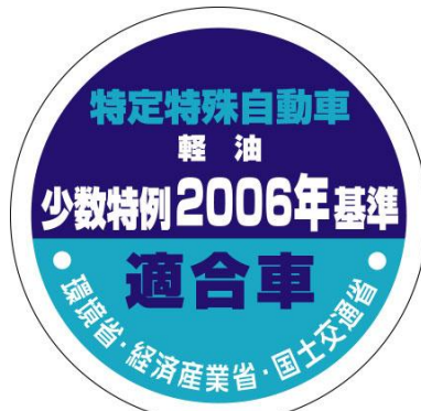
少数生産車用 (改正前の基準適合車)