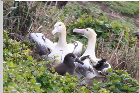
繁殖ペア(手前はクロアシアホウドリ)