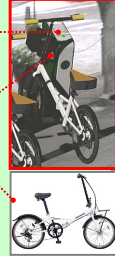
写真 使用予定自転車