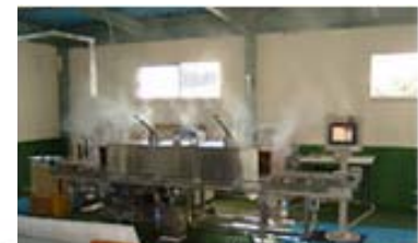
次世代木材乾燥機