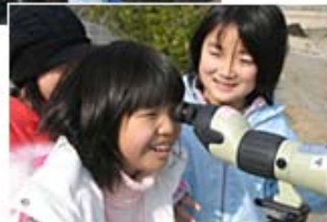
市民への環境教育