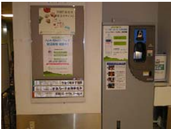
写真6 自動回収機 (京急百貨店)