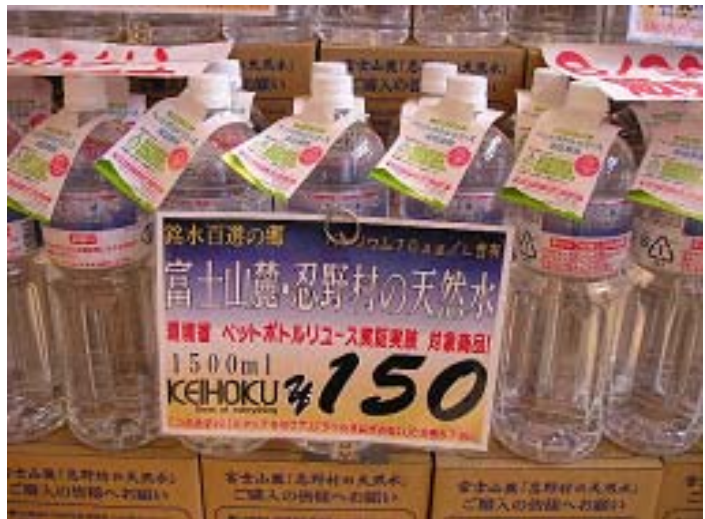
写真1 商品ポップ (apris KEIHOKU)