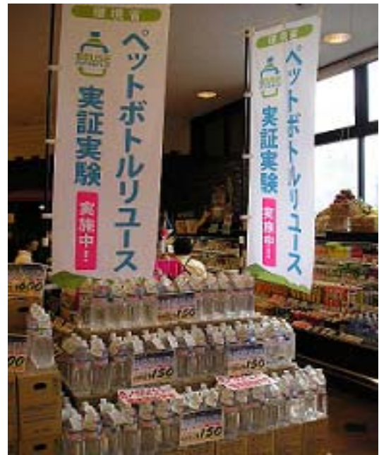
写真5 売り場の様子