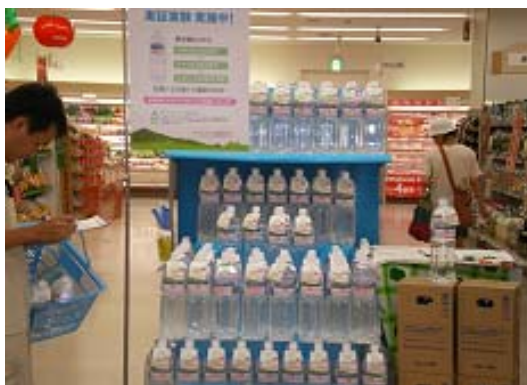
写真2 売り場の様子 (イトーヨーカドー 網島店)