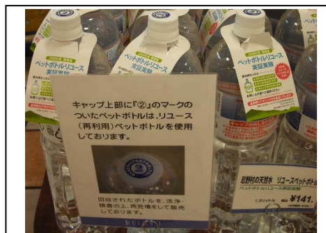
写真2 ②のシールの説明POP

また、オープンシステム・クローズドシステムとも、デポジットにより返却のインセンティブを付与した（横浜市：10円、柏市：20円を商品価格130円に上乗せして販売）。