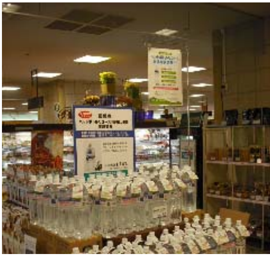
写真4 売り場の様子 (京急百貨店)