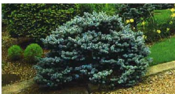
(1) プンゲンストウヒ ‘グロボーサ’