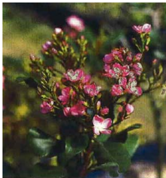
(11) シャリンバイ ‘コーツ・クリムゾン’