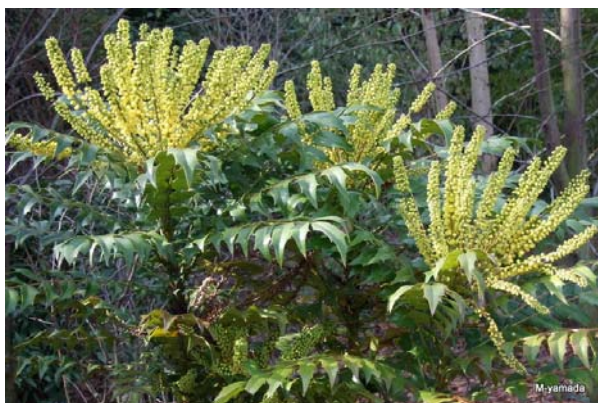
(9) マホニア ‘チャリティー’