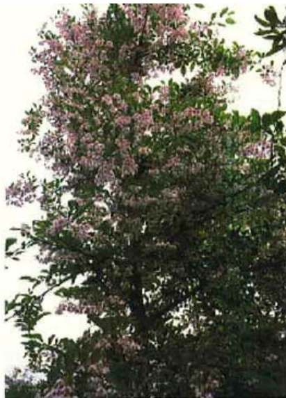
(26) エゴノキ 'ピンク チャイム'