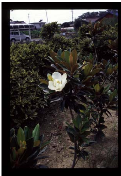
(9) タイサンボク ‘リトル ジェム’