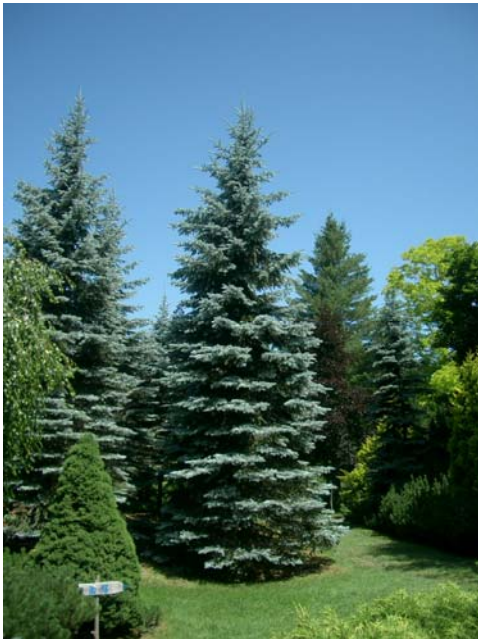
(5) プンゲンストウヒ ‘ホープシー’