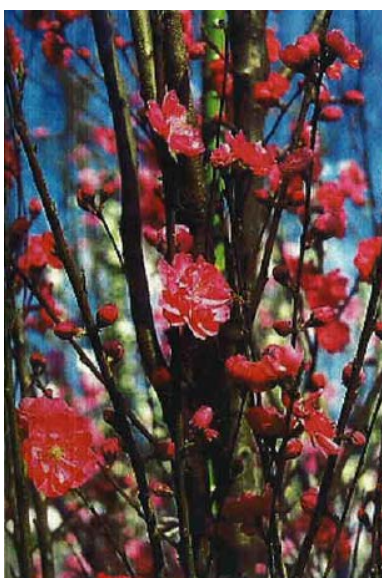
(20) ハナモモ '照手紅'