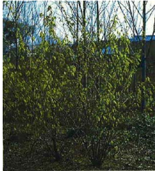
(4) ニオイトサミズキ