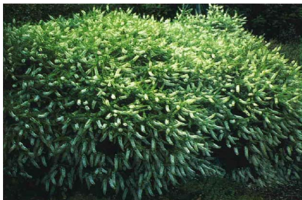
(5) アメリカリョウブ ‘ハミングバード’