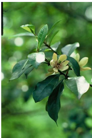
(10) カラタネオガタマ