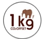
缶バッジイメージ

また当イベントにて投票にご参加いただいた方には、1キログラムのCO2排出権付きのカーボンオフセット缶バッジと、エコ・アクション・ポイントをプレゼントいたします。