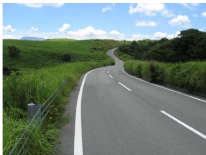
① 大津北外輪山線車道沿線