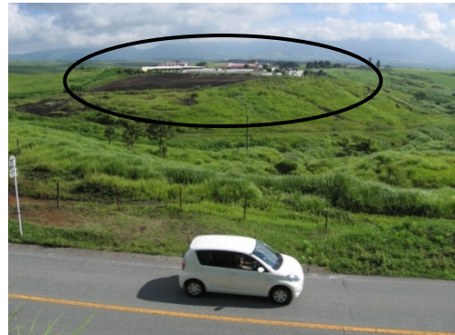
⑤⑱城山北（園地を乗馬施設に振り替え）