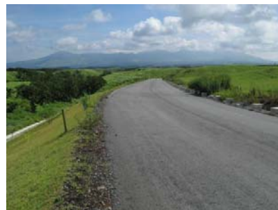
② 小国阿蘇線車道沿線