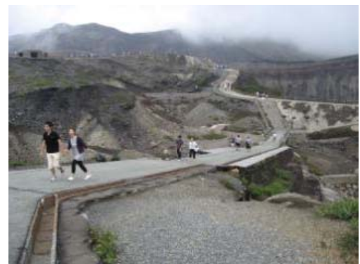
④中岳中央火口園地