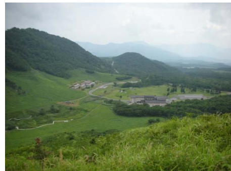
②鏡ヶ成集団施設地区