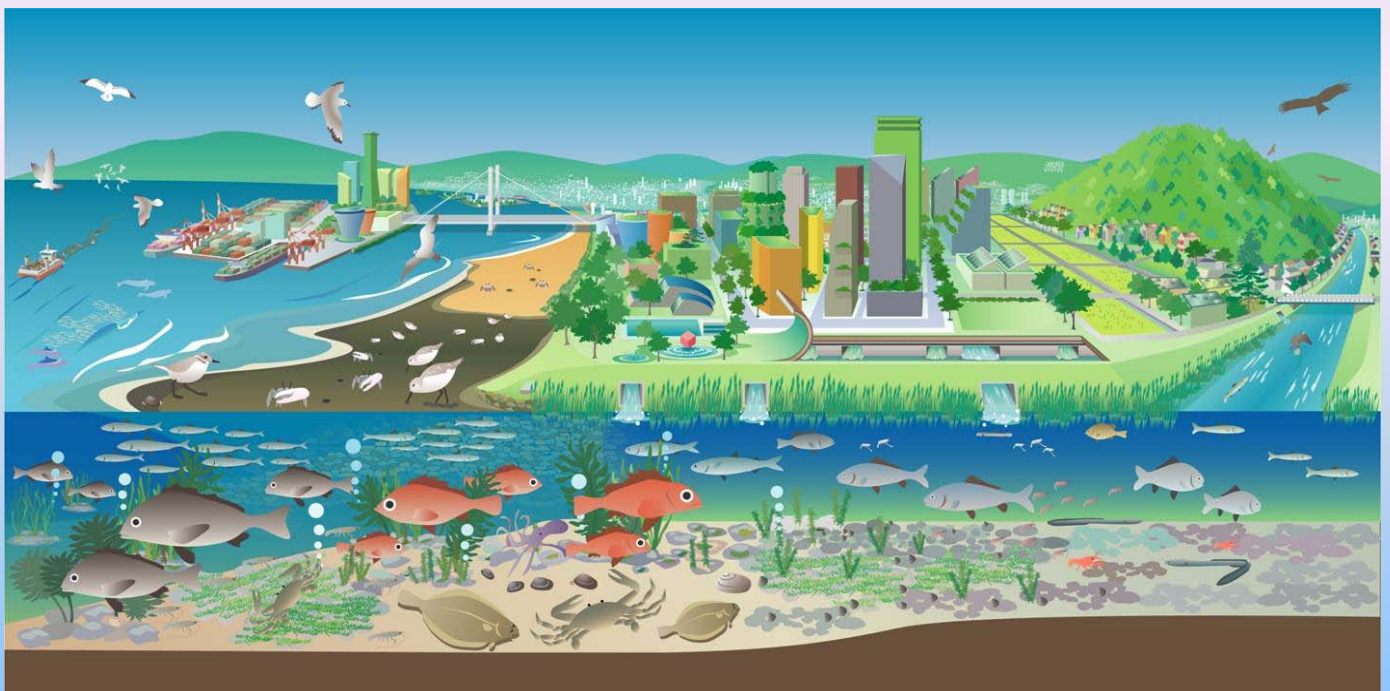
↑ 大阪湾再生のイメージ