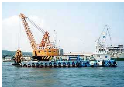
図-3.1 浚渫作業状況（例）