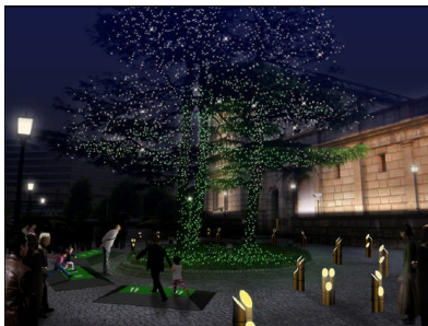
「ECO EDO 日本橋発電所」

また、「エコ・アクション」により貯められた「エコ・アクション・ポイント」は、1ポイント10円に換算のうえ、合計金額をイベント主催者より、中央区の推進する「中央区の森」活動(P7参照)に寄付いたします。