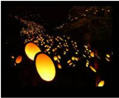
【竹田市「竹楽」実施風景】

また、常盤橋フォーラム・ECO EDO 日本橋実行委員会主催の「常盤橋竹灯籠」イベントとも連携。常盤橋にも大分県竹田市の「竹灯籠」が設置されるほか、日本銀行本店前庭(17:00～22:00)、コレド日本橋にも設置します。