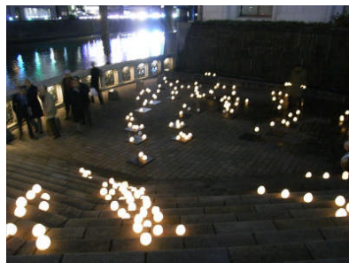
「日本橋キャンドルナイト」