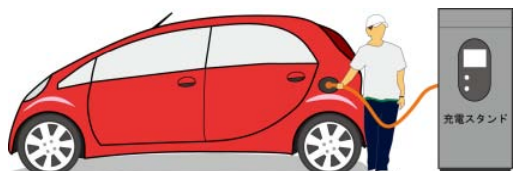
EV(電気自動車)充電イメージ