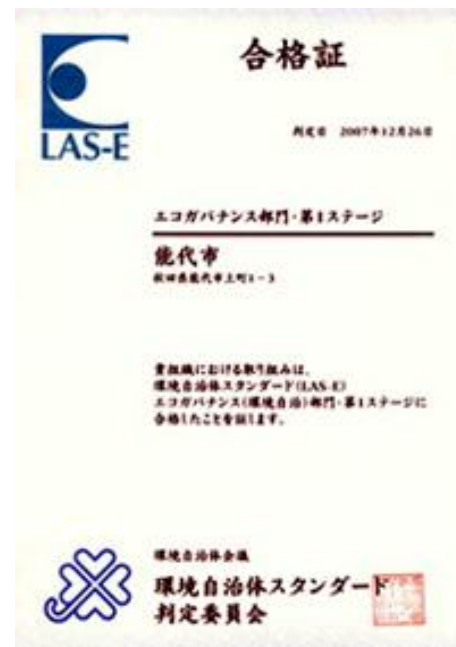
第1ステージの合格証(平成19年12月)