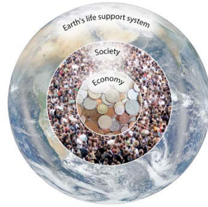
図1 21世紀における「持続可能な開発」の再定義

第二に、プロジェクト内外で多分野における連携の仕組みとネットワーク構築を行った。各テーマが提供する知見を効果的に統合し、統合的なSDGsの目標や指標を提示するため、各テーマからの研究参画者・協力者で構成されるタスクフォースを設置した。タスクフォースでは「水と教育」「食糧と健康」「資源生産性」といった政策課題に着目し、SDGs提案を検討した。プロジェクト・マネジメントでは、全体統括を円滑に進めるため、テーマリーダー会合やアドバイザーボード会合を適宜開催し、国内外の当該専門家からのアドバイスを取り入れたり、進捗管理やテーマ間調整を行ったりする機会を設けた。また、テーマ横断ワークショップ等も開催した。