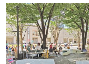
グリーンインフラ