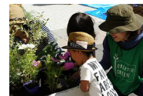
グリーンカルチュラルエンジニアリング

集合住宅や商業施設における植栽管理を通じて、人と人の繋がりを生み出すコミュニティ創出に取り組む。