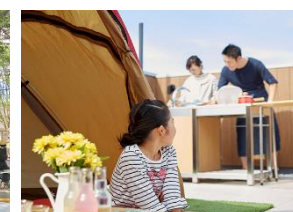
グリーンライフスケープ