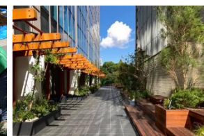
グリーンデイバロップメント

集合住宅や商業施設における植栽管理を通じて、人と人の繋がりを生み出すコミュニティ創出に取り組む。