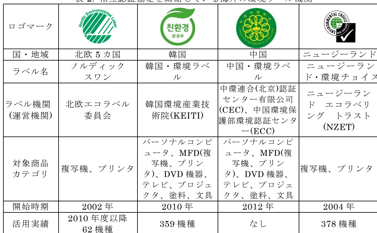
表 2. 相互認証協定を締結している海外の環境ラベル機関

日本のエコマークが相互認証協定(MRA)を締結している海外のタイプ I 環境ラベル機関との相互認証について、最新の実施状況を整理した。2017年3月時点で、エコマークが相互認証協定を締結している環境ラベル機関は以下の10機関である。