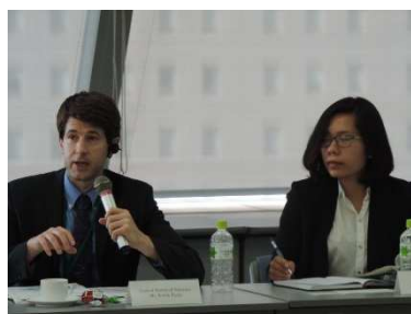
担当者意見交換会の様子