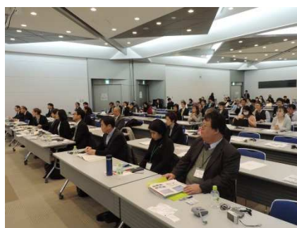
国際シンポジウムの様子