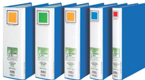
(チューブファイル)