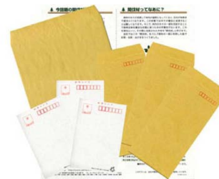
(業務用茶封筒、はがき、名刺など)