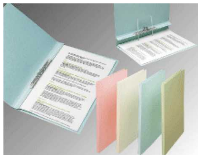
(フラットファイル)