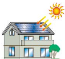
設備(例：太陽光発電システム)