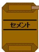
公共工事(例：資材：混合セメント)