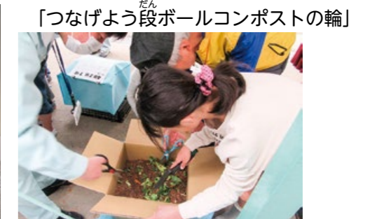
資料：八王子市立式分方小学校