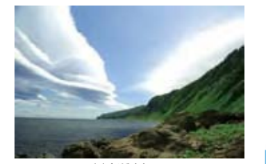
しれとこみさき 知床岬へ続く海岸線

知床には、火山などによって作られた険しい山々、切りされたような海岸のがけ、いくつかの湖からなる湿原などがあり、海岸から標高およそ1,600mの山までの間には、ヒグマやシマフクロウなど自然のままの動植物がずっとつぎとあらわれます。