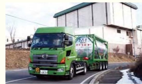
4 中津川市

電気自動車やその充電施設の整備に取り組んでいます。また、大型の電気バス(電動低床フルフラットバス)を企業・大学などと協力して開発し、県内2か所で環境にも人にもやさしい公共交通として実証試験を行います。