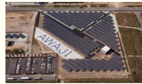
5 淡路市

ゴミ焼却場の排熱を、蓄熱材を積んだタンクローリーにつめ、市内の病院に運び、そこでの暖房や給湯に使用しています(トランスヒートコンテナ)。また、別の病院では地面に深い穴を掘り、年中安定した地中の熱を病院内の空調において活用しています。