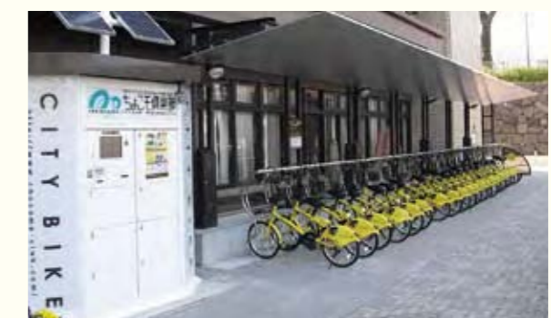
7 北九州市

山岳地帯にある風力発電所で発電した電気を売り、その利益で家庭用太陽光発電設備の導入や森林の間伐に対する補助をしています。また、森林の整備をきちんと行うとともに、間伐材をペレット燃料にして活用しています。