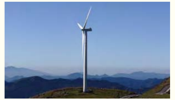
6 栲原町 栲原町風力発電

年中、日当たりのよい土地がらをいかし1,000キロワットもの太陽光パネルを敷きつめた、メガワットソーラー発電を建設。市庁舎や下水処理施設、防災センターなどの電源を、ここで作られた電気でもかかっています。