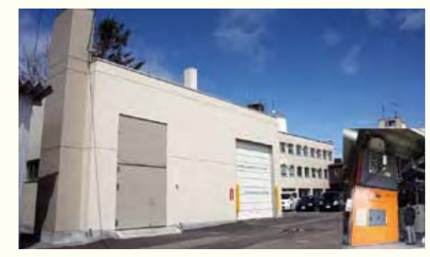
1 下川町

捨てられる間伐材を燃やし、できた熱をパイプラインで周辺の役場や消防署などの暖房に活用しています(地域熱供給施設)。また、成長が早い「ヤナギ」をエネルギー作物として育て燃料などに利用する取組を行っています。