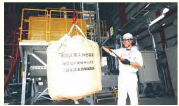
2 奥州市

捨てられる間伐材を燃やし、できた熱をパイプラインで周辺の役場や消防署などの暖房に活用しています(地域熱供給施設)。また、成長が早い「ヤナギ」をエネルギー作物として育て燃料などに利用する取組を行っています。