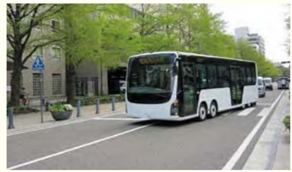
3 神奈川県

木のチップやてんぷら油などから環境にやさしいバイオマスガスやバイオディーゼル燃料を製造しています。また、この燃料を使いコージェネレーションシステムで熱と電気を作り市内の温泉施設のエネルギー源としています。