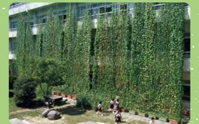
さいゆうしゅうさくりん 最優秀作品/作品名：天までとどけ！ 応募者名：七尾市立山王小学校

環境省では夏の節電・省エネ対策としてこの取組を推進しています。その一環として「グリーンカーテンPROJECT2011 フォトコンテスト」を行いました。全国から900作品以上の応募がありました。