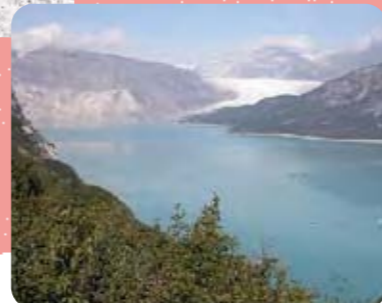
Click image for a high-resolution version