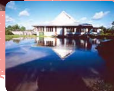
© shuuichi endou / Tuvalu Overview

赤道付近の島国ツバルでは 海水面上昇により 島が水につかる被害が! (ツバル・フナフチ島)