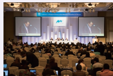
写真5-2-1 水俣条約の外交会議の様子

なお、我が国は、後述する国内の担保措置を整備し、それを受けて平成28年2月2日に水俣条約を締結しました。