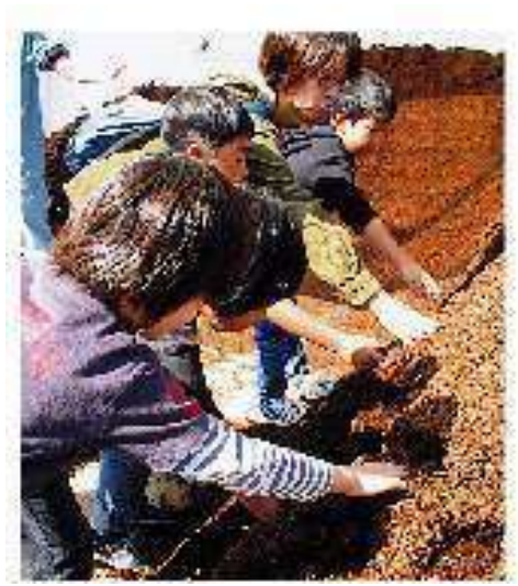
食品残さの堆肥づくり