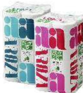
アローザ トイレットペーパー （リサイクルボックスで回収した牛乳パックが原料）