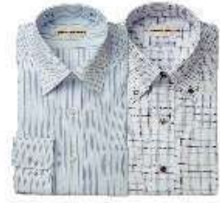
カルキュロ エコ 紳士用ドレスシャツ （使用済ペットボトルが原料）