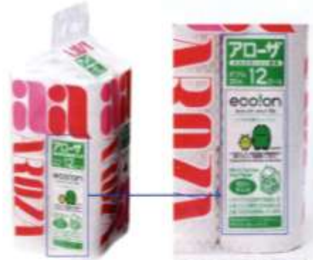
ユニーのPB「eco!on」ブランドの「アローザ トイレットペーパー 12ロールシングル」(330円)。従来の国産した牛乳パックなどを加工し、廃品として販売することで消費者に還元する。パッケージにはリサイクルマークが記されている。

ユニーが目指すのは、商品の販売を通じた社会貢献だ。販売した商品をゴミとして回収し再利用し、ゴミを社会にとどめないことが、社会貢献だと位置付けている。消費者や外部の人々を参加させることでコミュニケーションが生まれ、リデザインプロジェクトや eco!on ブランドは進化していく。