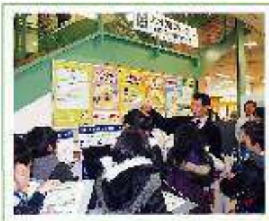
リサイクルステーション見学