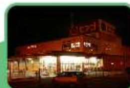
ブラック イルミネーション