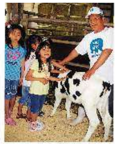
酪農家で子牛に触れ合う