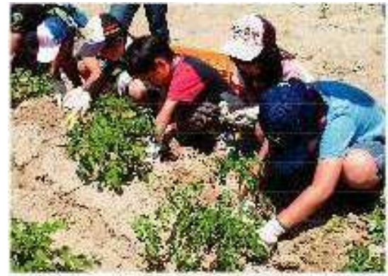
三功の循環型農業体験