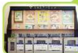
リサイクル ステーション