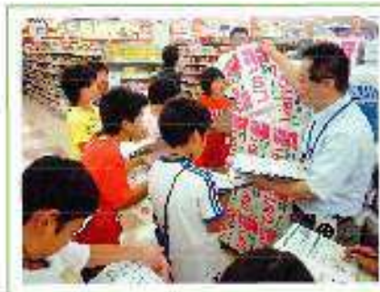
環境に優しい商品見学