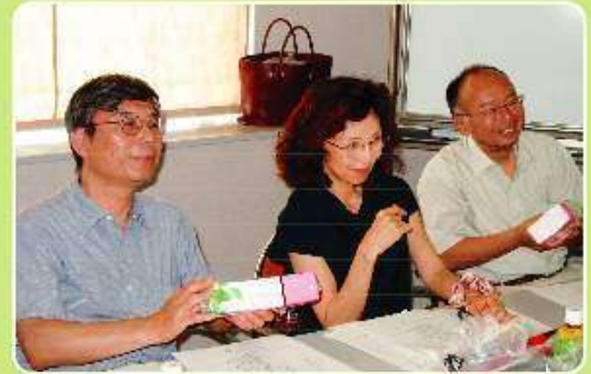
第三者審査員主要メンバー（写真左から）