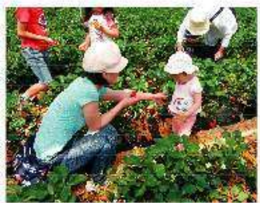
循環型農業収穫体験