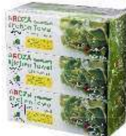
アローザキッチンタオル （リサイクルボックスで回収した牛乳パックが原料）