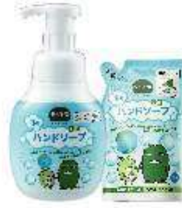
泡のハンドソープ （店舗から出た使用済食用油が原料）