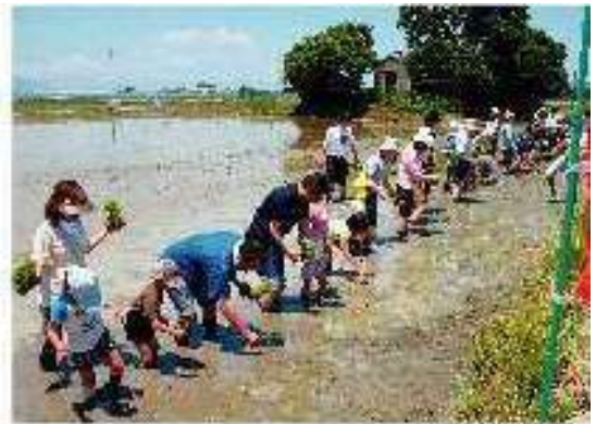
JA あいち海部で田植え