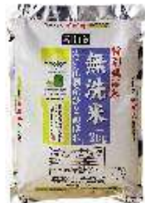
特別栽培の無洗米 （お米を研がないため河川を汚さない）