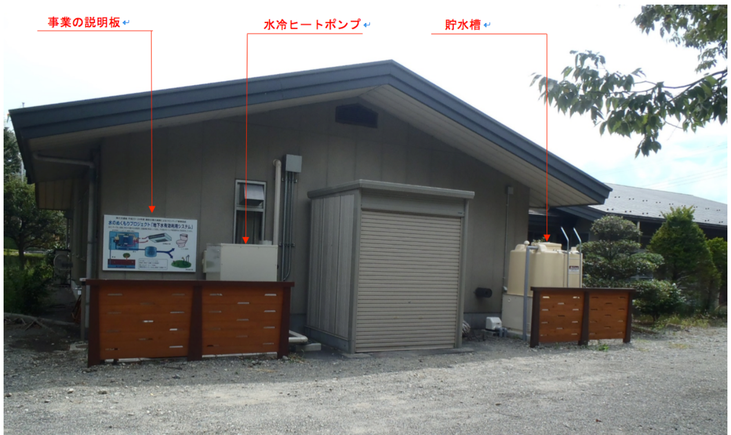
写真1 中央市田富福祉センターに設置されたヒートポンプ空調システム