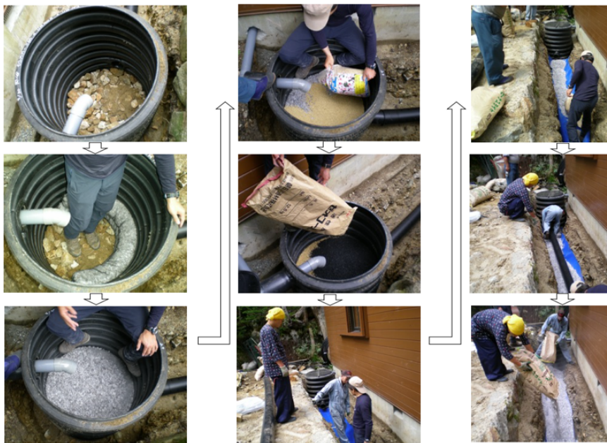
図3 し尿処理施設毛管浄化工施工風景