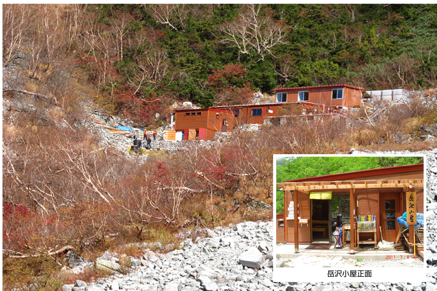
写真1 長野県北アルプス岳沢小屋