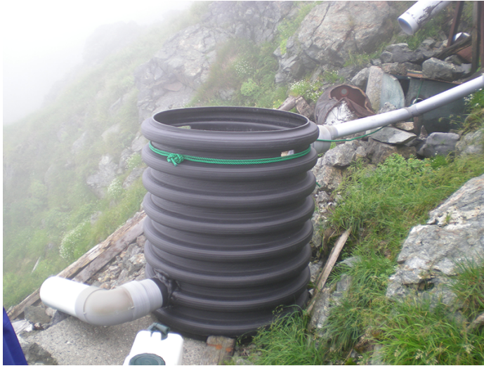
図1 現地浄化型簡易し尿処理の仕組み