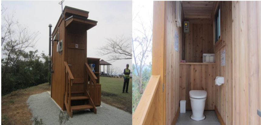
写真2 福岡県みやま市清水山のバイオチップトイレ 建屋 (左) 及び室内 (右)