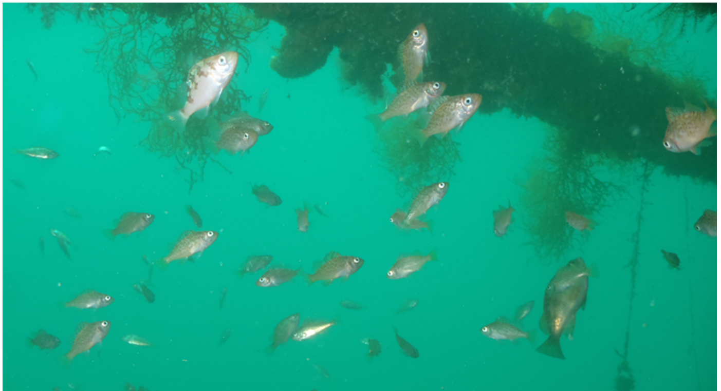
写真：敦賀港人工中層海底 設置状況

国土交通省四国地方整備局 高知港湾・空港整備事務所の宿毛港湾型：平成 22 年～ 27 年