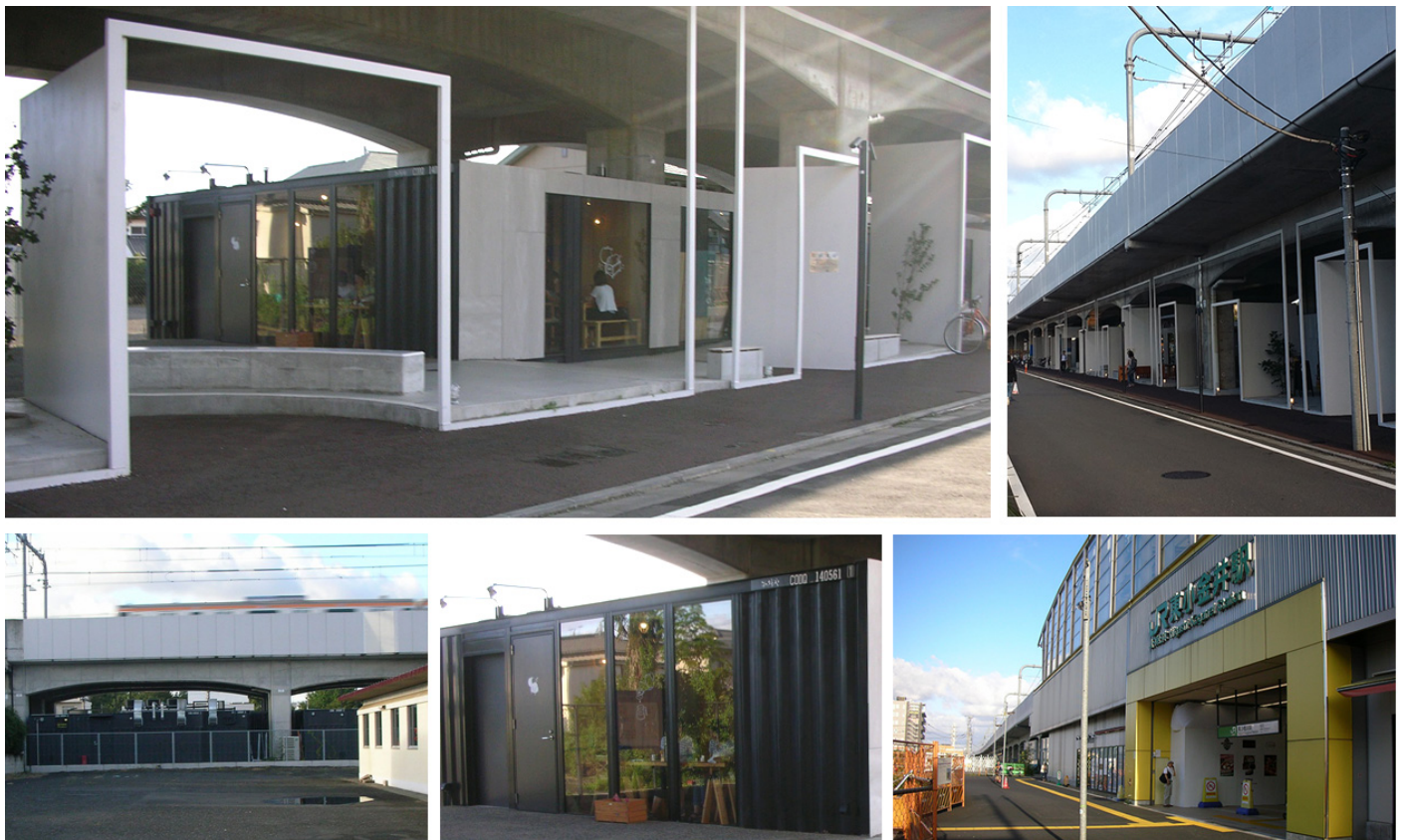
写真1 コミュニティステーション東小金井（JR 関連）

導入先：導入時期 コミュニティステーション東小金井（JR 関連）：平成 27 年 8 月等