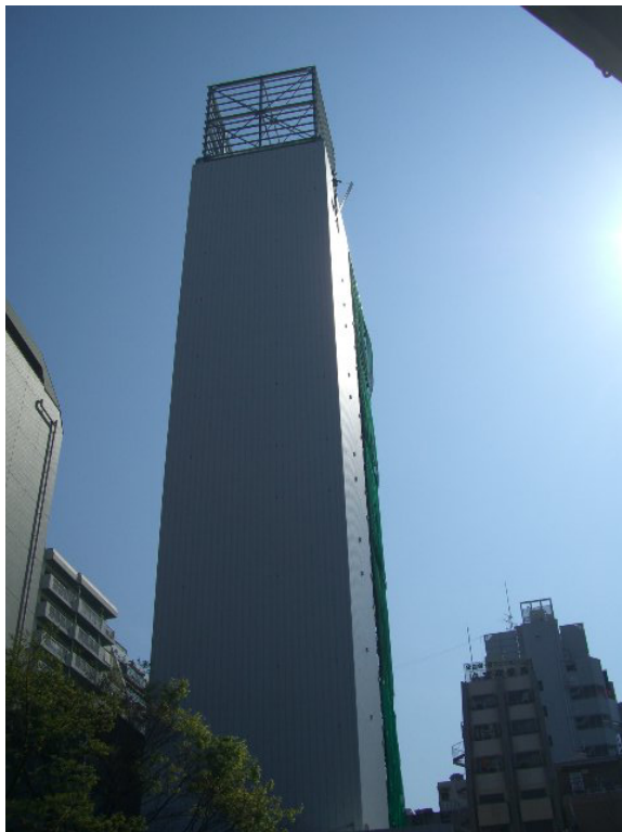
写真3 エコグリーン・パーキング

可能な限り熱線高反射性能を有する顔料を使用することで、熱線を効率よく反射し、塗装面や建物内部の温度上昇を抑制する。