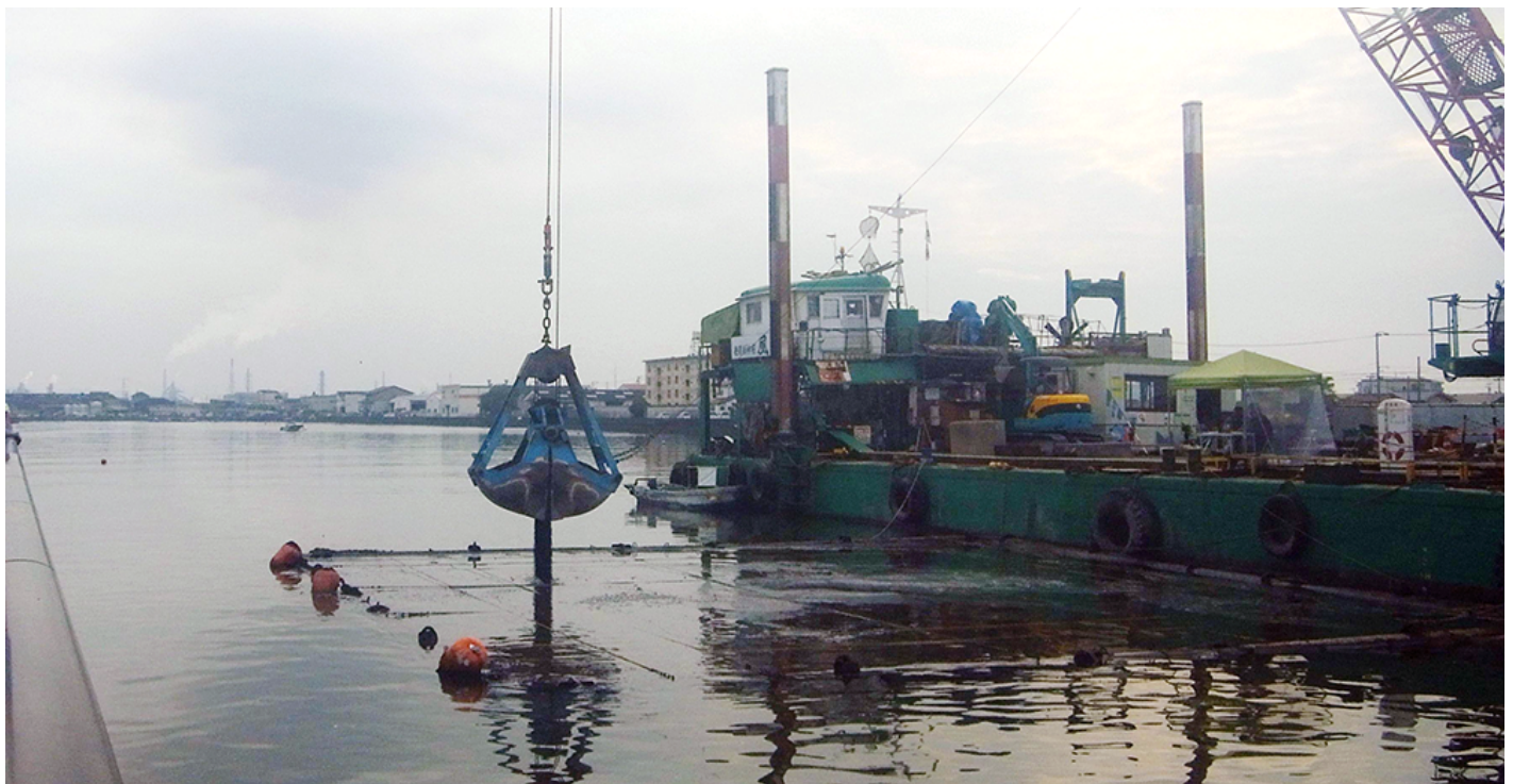
写真2 マリンスター® 施工風景