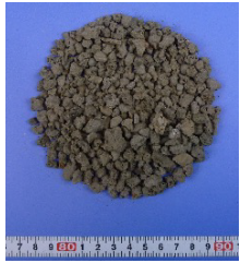
マリンスター®10 (粒径 5-10mm)