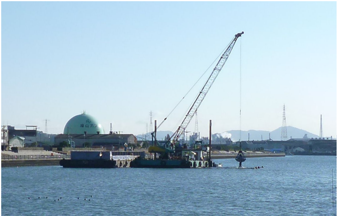
写真 1 マリンストーン®（製鋼スラグ底質改善材）施工状況