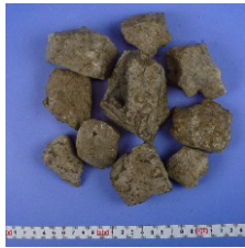
マリンスター® 50 (粒径 30-50mm)