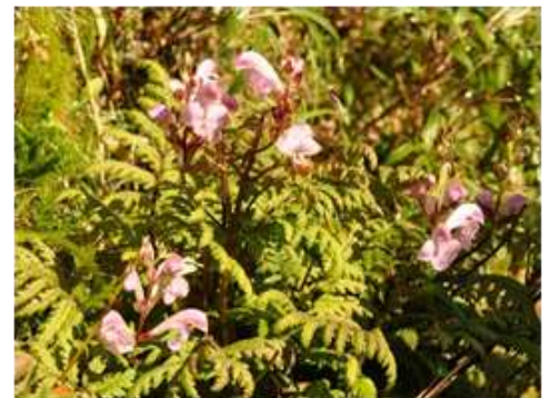
ゴマノハグサ科 ヤクシマシオガマ 9月5日 撮影