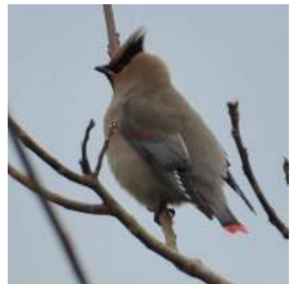
レンジャク科ヒレンジャク 1月7日 長峰牧場