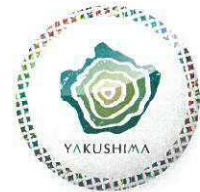
< バッジの一例 >

観光事業者と連携した環境保全の取り組みとして、これらのバッジ(例)を町内の協力店でご提示いただくと、観光にお得な各種サービスが受けられます。サービス内容は、ホームページ等で連絡先をご確認の上、協力店にお問い合わせください。