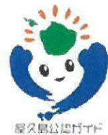
屋久島公認ガイド

屋久島では、観光を通じて自然保護や環境保全への理解を深める、エコツーリズム体験を行っています。その一つとして、「屋久島公認ガイド」を利用した観光があります。屋久島の山・海・川での自然体験を安全かつ、楽しくサポートしてくれます。「屋久島公認ガイド」のご予約は、HP( http://www.yakushima-eco.com )をご確認の上、電話やメールなどで直接ガイドにお申し込みください。