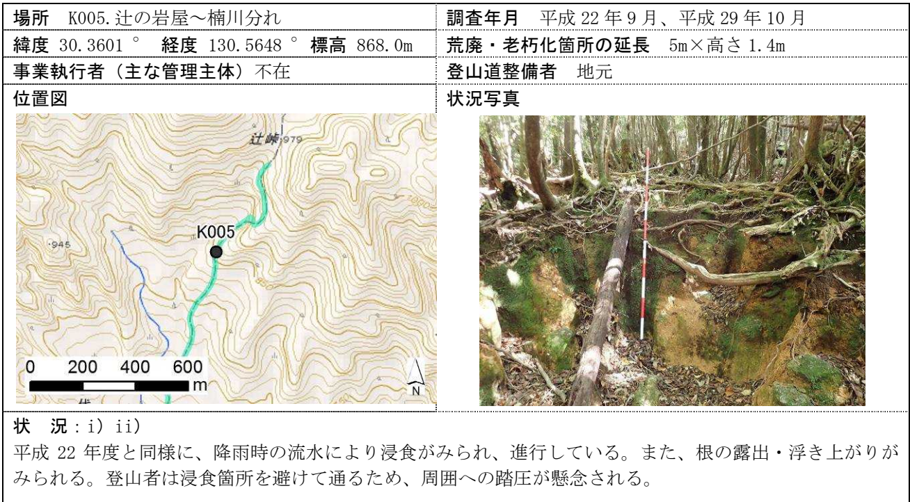
図 荒廃箇所の一例