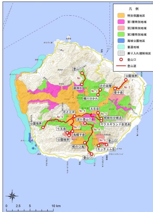
図：平成29年度調査位置図

平成29年度調査した9路線のうち、花之江河ヤクスギランド線、湯泊線、尾之間線で浸食等荒廃箇所が比較的多く確認された。平成22年度の第1回調査時より荒廃が進行した箇所も見られた。降雨時の流水による浸食、法面の露出が見られ、根の浮き上がりが生じている箇所がある。