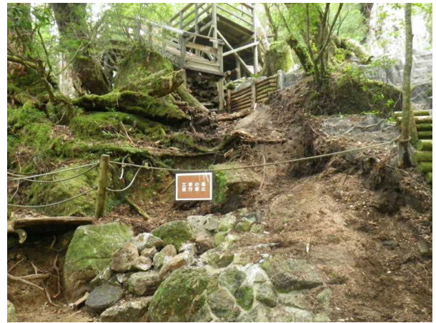
環境省北デッキ作設に伴い一部撤去