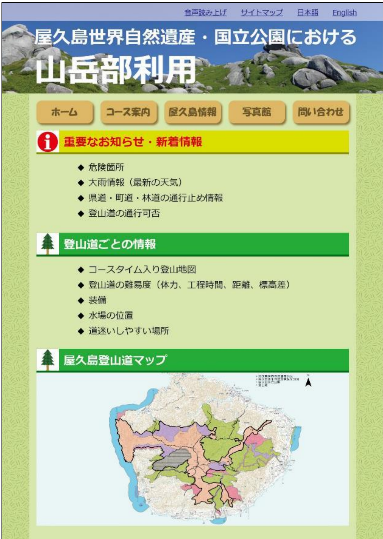
図1 ポータルサイト (ホームページ等) のイメージ (1/4)